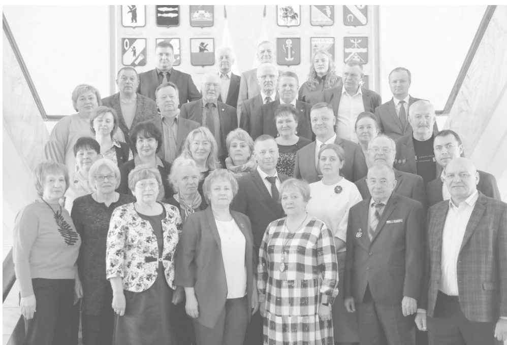
Встреча губернатора с руководителями общественных приемных

Глава региона Михаил Евраев провел встречу с руководителями общественных приемных губернатора Ярославской области в муниципальных образованиях.